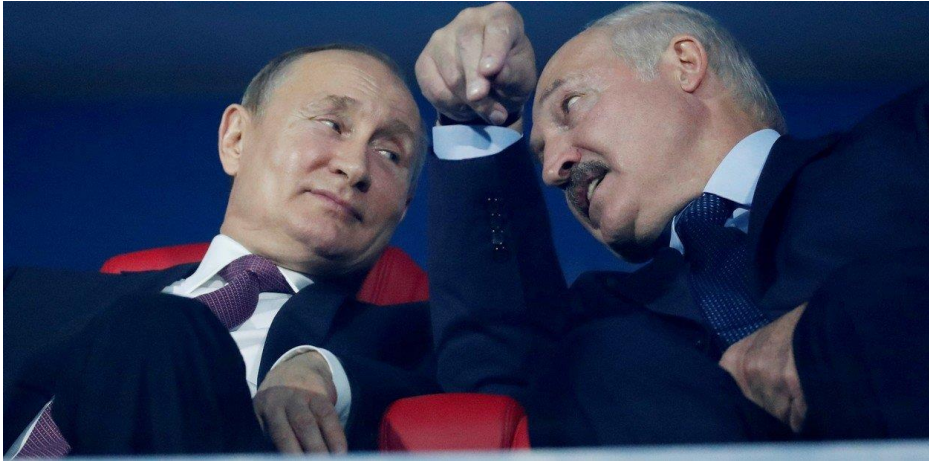
Vladimir Putin y el presidente de Bielorusia Alexander Lukashenko.